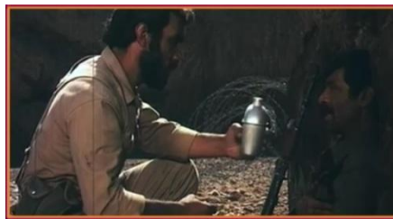
تصویر شماره ۶

صدا (دیالوگ و موسیقی): صدا از رمزگان فنی فیلم است که خود شامل دو بخش دیالوگ شخصیت‌های فیلم و آهنگ پس‌زمینه است.