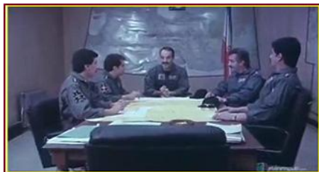
تصویر شماره ۵