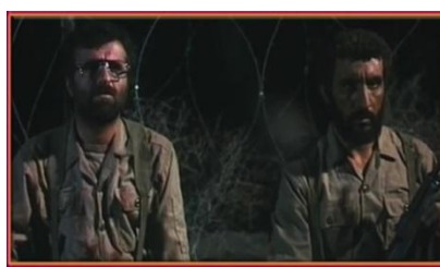
تصویر شماره ۴