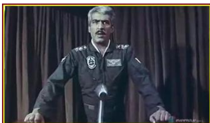
تصویر شماره ۳