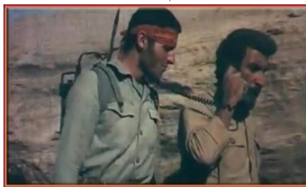
تصویر شماره ۸

دوربین: دو دسته از امکانات فنی دوربین «نماها و زاویه» در انتقال و القاء معانی مورد نظر کارگردان تأثیر به‌سزایی دارند که به تحلیل آن بر فیلم پرواز در شب و عقاب‌های پردازیم.